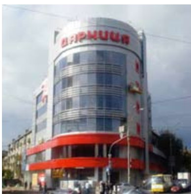
Торговый комплекс на Ленинградской площади, г. Киев (цоколь, внутренняя отделка, 500 кв.м)