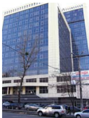
Бизнес-центр на ул. Антоновича, г. Киев (цоколь, 800 кв.м)