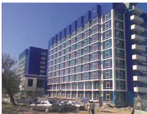
Гостинично-жилой комплекс «Аквамарин», г. Севастополь (цоколь, 2500 кв.м)

Sika — международный концерн, работающий в области специальной химии. Дочерние компании концерна по производству, продаже и технической поддержке представлены более чем в 70-ти странах мира.